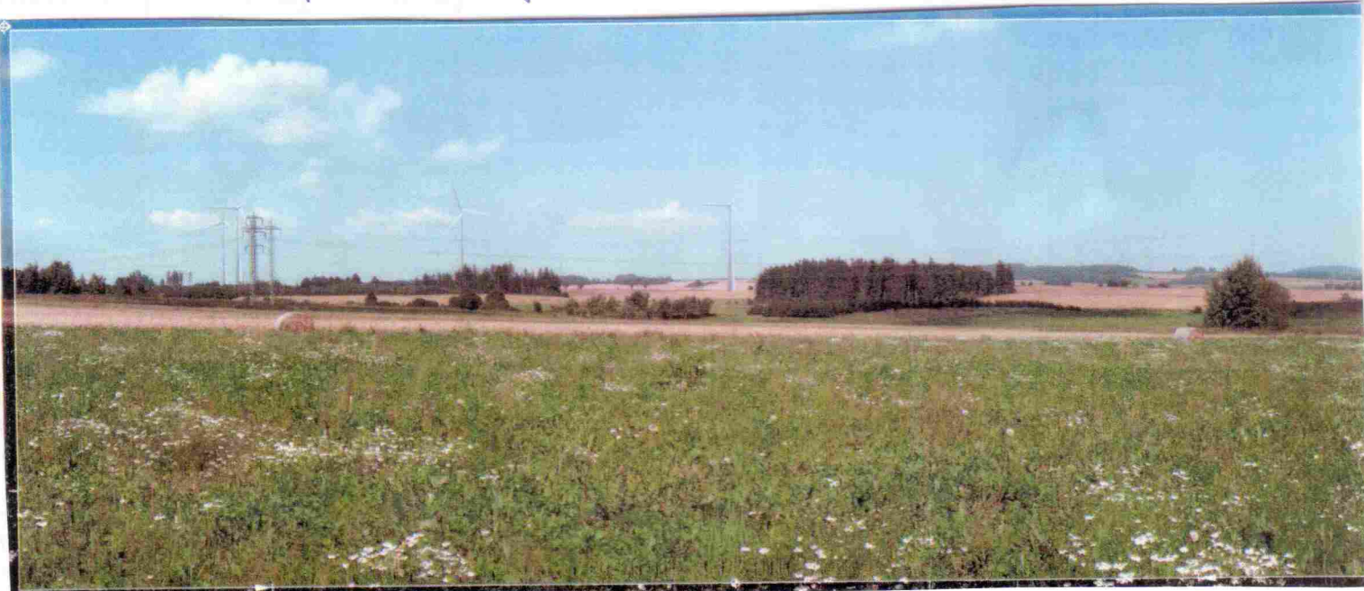
Obr. č. 3: Uvažovaný větrný park v ploché krajině mezi krásným údolím, Sedčínem a Litvínovými