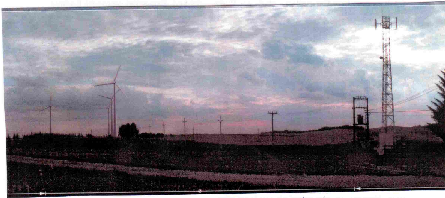
Obr. č. 5: Podvečerní výhled z fyzického obraze obce Krásné Údolí