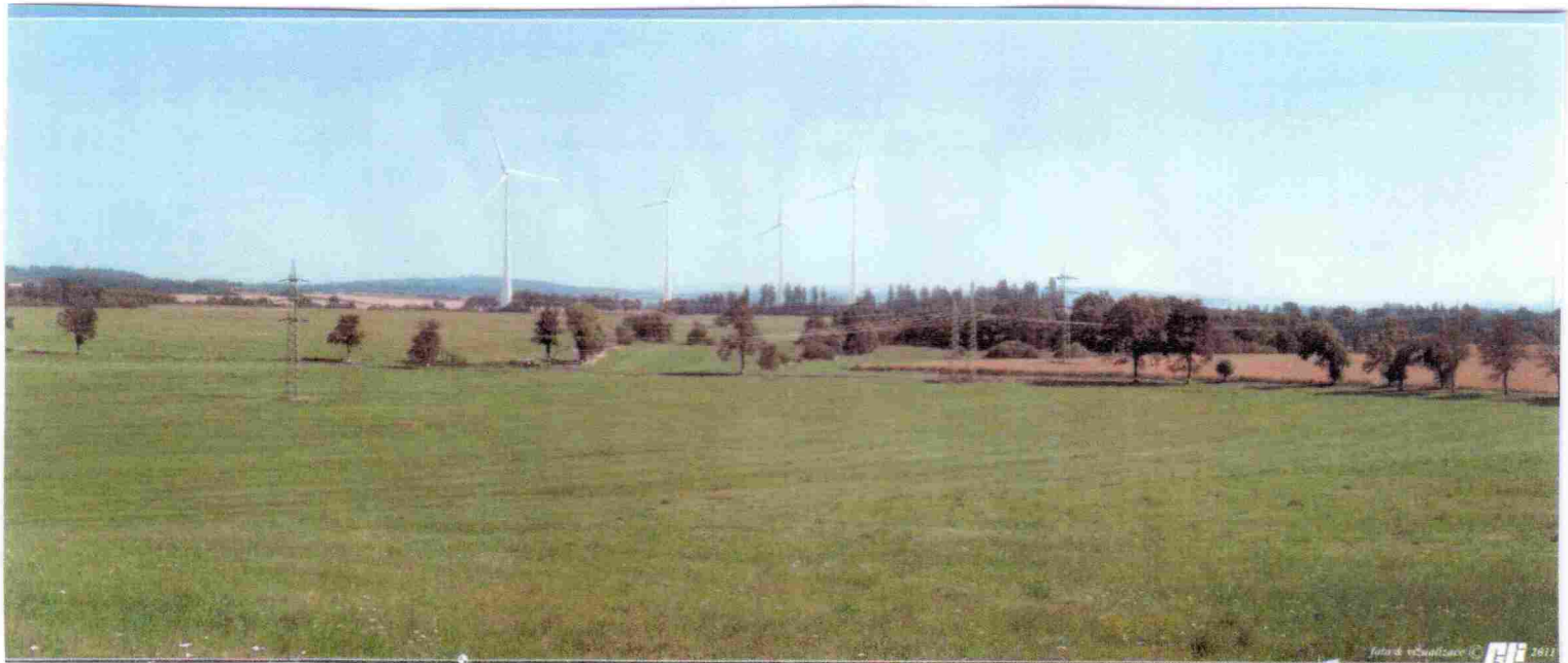
Obr. č. 2: Původní záměr z kóty u Křížku mezi Měchovem a Brdšínem