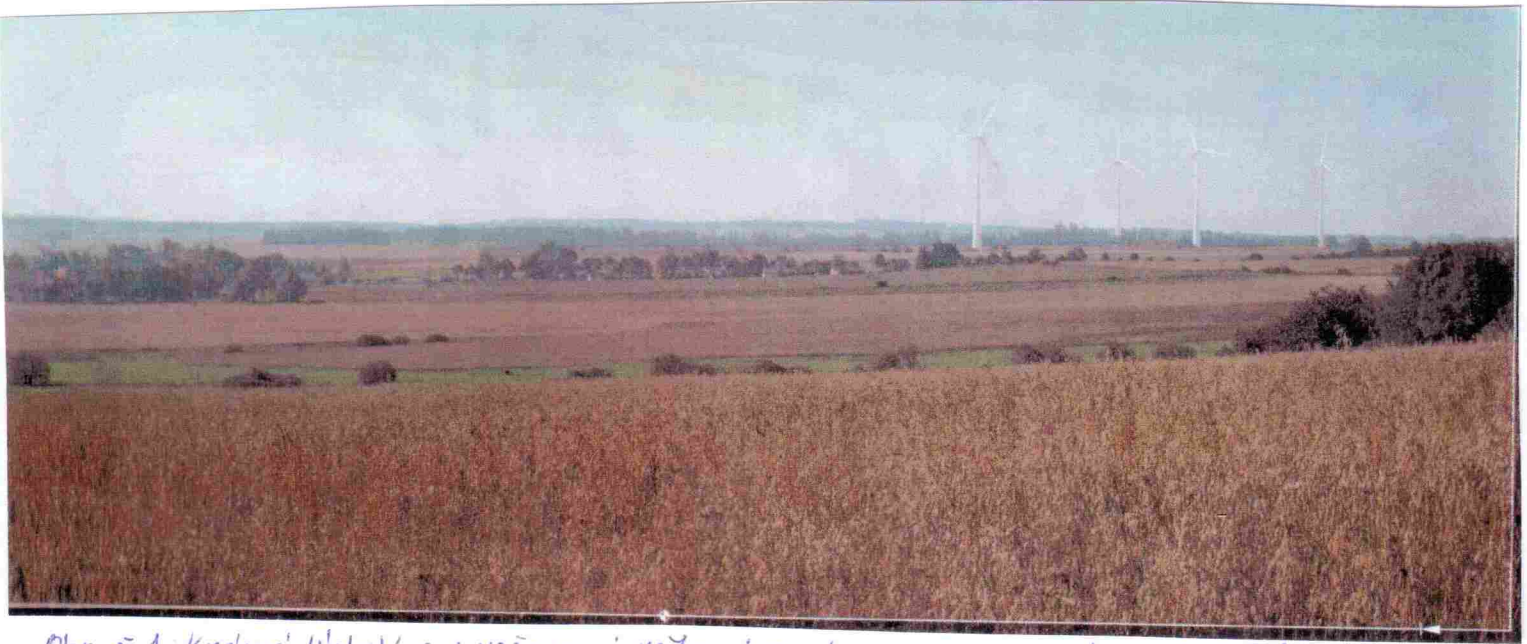
Obr. č. 1: Krásné údolí a uvažovaný větrný park v panoramatu od Odolenovic